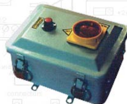
STS10 (met sensor)